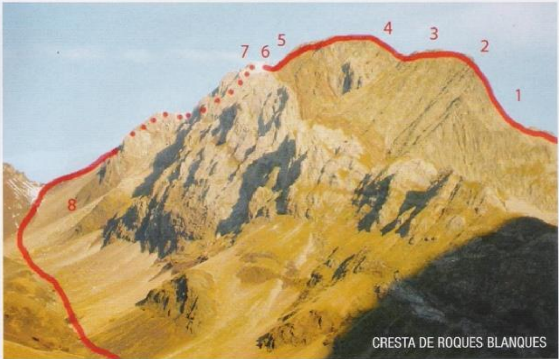
CRESTA DE ROQUES BLANQUES