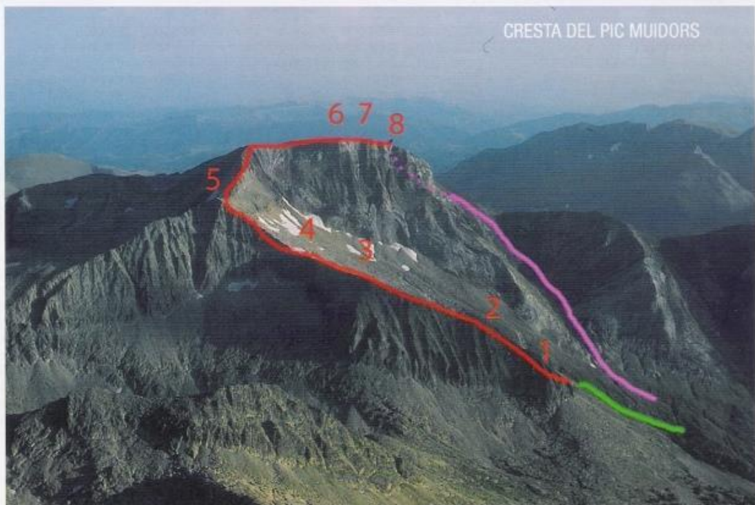
CRESTA DEL PIC MUIDORS