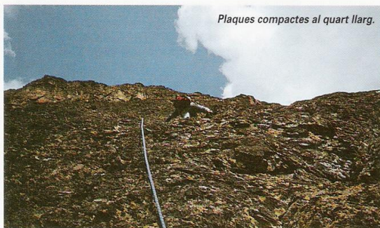
Plaques compactes al quart llarg.

ria era el Pirineu més proper, en tots els sentits, a les gran poblacions de les comarques barcelonines. Darrera els adormits lloms de l'Olla resten amagades unes valls fantàstiques amb noms que semblen trets d'una falla ancestral: Estantyet i Carança.