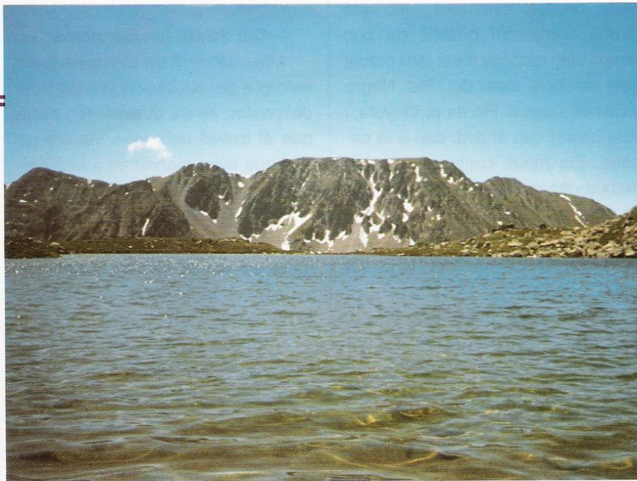
Pic Colomer des de l'estany de Passaderes

4) Tot crestejant el fàcil circ d'Engorgs passant pel pic de Bes-