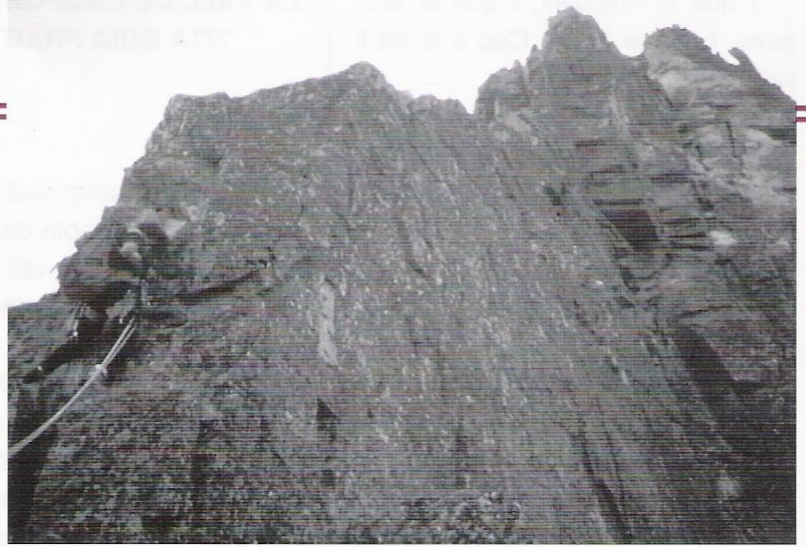
Arribant al Roc Colom

Després de la llarga jornada, la nit va ser dolenta: ningú no volia fer bivac. Vam dormir tots cinc a la tenda. Els mosquits van tastar els nostres cossos com a bons gurmets, i tot cal dir-ho, va aflorar certa tensió i alguna picabaralla entre nosaltres.