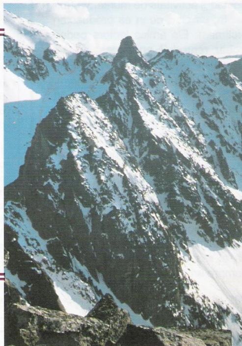
Arribant al Roc Colom →

* Mapa I.G.N. francès - carta 2249 OT - escala 1:25.000