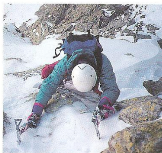
Tram d'entrada a la Canal Eclair

amb pendissos més inclinats, una bonica sortida, la possibilitat de trobar un ressalt rocós i l'ornamentació de les estètiques cornises que es recargolen sobre si mateixes. Es tracta d'una bona opció per als qui ja han visitat el circ i es volen aventurar a fer un itinerari un xic més difícil que la clàssica proposta del Vermicelle.