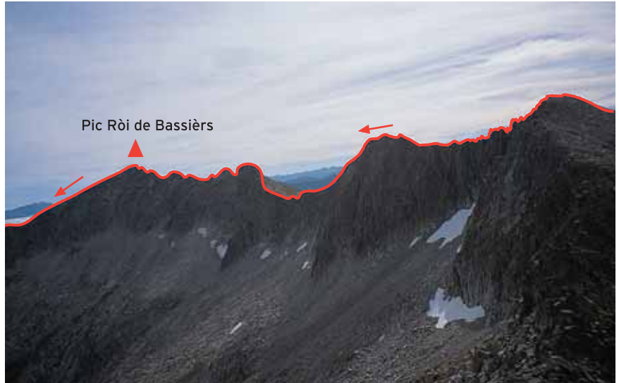
Segona part de la llarga cresta que uneix els solitaris cims de la Lessa i Ròi de Bassièrs.

orientació NW. Passem pel costat d'un petit pi i arribem al peu d'un mur amb una "R" pintada. Flanquem sota el mur, cap al N, per enfilarnos a l'aresta. Superem uns blocs (III o /III+), algun dels quals es mou. Uns relleixos amb herba ens conduiran a una altra zona de blocs (II o ) fins a un primer cim. Descendim cap a l'W per una xemeneia i uns blocs (III+) que són exposats perquè a sobre tenen terra (els podem evitar amb un ràpel de 15 m des d'un pi). Arribem a una canal herbosa inclinada. La flanquem en direcció NW. Evitem un gendarme pel vessant S i un altre pel N (II o ). Atenyem una bretxa i pugem per unes grades fins a un segon cim (II+). Seguim per un tram horitzontal i aeri (III-) fins a una altra bretxa. Flanquem al S i tornem a la cresta per unes plaques (III+). Trobem un gran tall (ràpel de 15 m) sobre una bretxa, des d'on flanquem pel N en una diagonal a la recerca d'unes plaques herboses (III o ). Som de nou als blocs aeris de la cresta. Trobem un altre tall; per superar-lo descendim al N fins a una lleixa herbosa (III o ) i fem un ràpel de 15 m. Davant tenim un mur difícil. L'evitem baixant per la canal situada al N de la bretxa, flanquejant per un relleix herbós i pujant per grades i petits murs (III-) a la dreta del fil de la cresta. Assolim així el pic