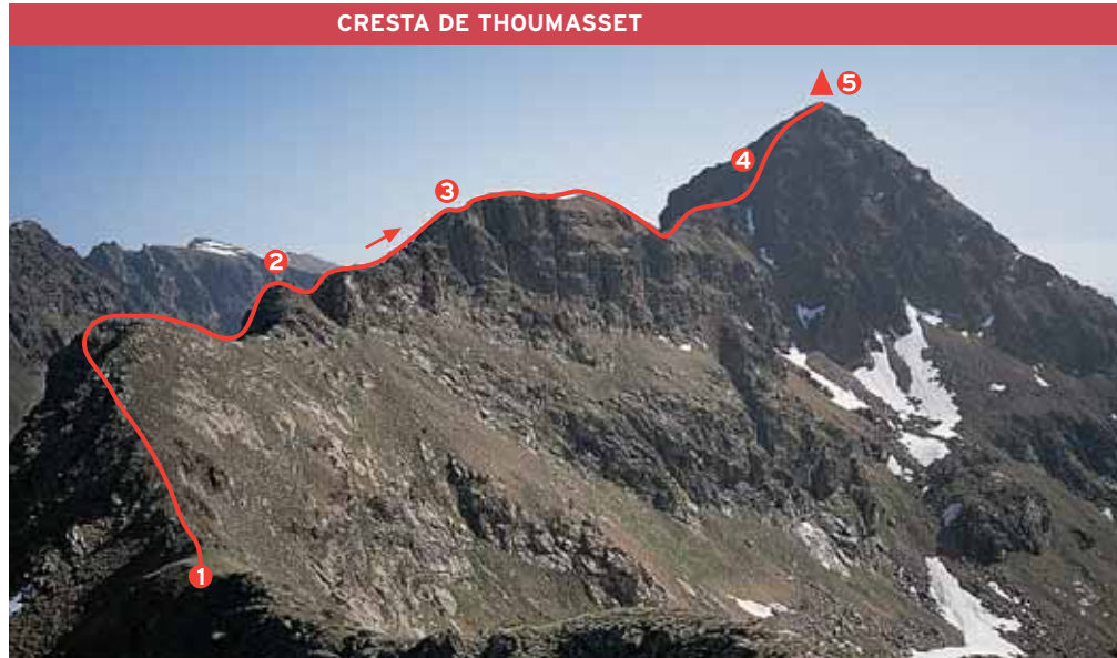
1. Pic de Banyell (2.638 m) • 2. Primeres roques escalables (II-) • 3. Mur de 20 m (II°/II+) • 4. Ascensió al cim per grades (II°) • 5. Pic de Thoumasset (2.741 m)

Descens: baixem per l'aresta NW, de forta inclinació, però sense cap mena de dificultat i que conclou en un ample coll. Abans d'arribar-hi, abandonem l'aresta-lloc i ens dirigim a l'W fins a l'estany Blau (2.335 m).