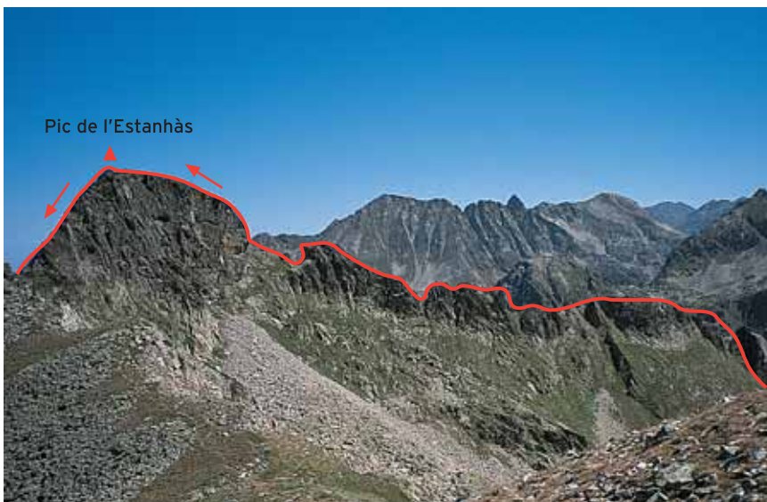
Primer tram de l'aresta que uneix la portella de les Vésines i el pic de l'Estanhàs, a l'esquerra, i que després segueix cap al pic d'Auriòl.

Descens: resseguim l'estètica aresta S del pic d'Auriòl fins a un collet situat als peus de la cota 2.494. Continuem vers l'E, a mitja altura pels prats del vessant S de la carena que prèviament haurem recorregut. Passem pel costat de l'orri (tancat) de Solà Colomè (2.188 m) i anem a parar al rierol que baixa de la portella de les Vésines, on reprendrem les passes realitzades durant la marxa d'aproximació. Calculeu 1:45 h per tornar al refugi. V