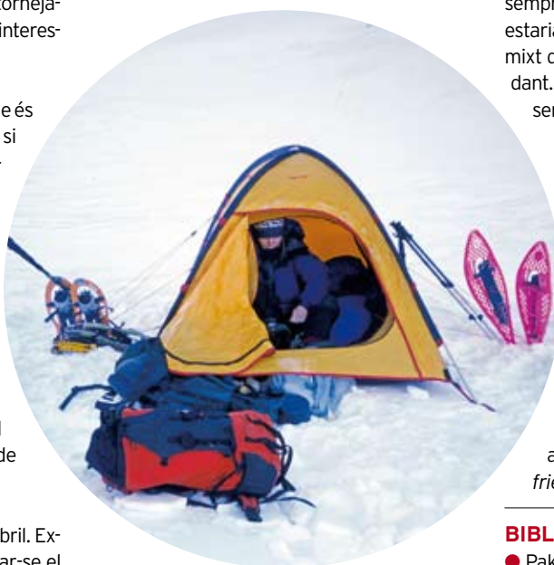
● Les aproximacions es poden fer sortint directament del cotxe o instal·lant "luxosos" campaments intermedis com aquest de sota el coll de la Marrana.

15. Via Magna solitudo (280 m. Màxim 60° i III° en mixt) Possiblement aquest itinerari, escalat el març de 1997 i no divulgat fins al moment, sigui el primer itinerari obert en aquest vessant tan peculiar i inhòspit. Enllaça unes canaletes de neu sobre una mena d'esperó emmarcat per dues canals més fàcils. La via va ser recorreguda en sentit descendent i tornada a realitzar en sentit ascendent. Poden ser-hi útils tascons o friends . ▼