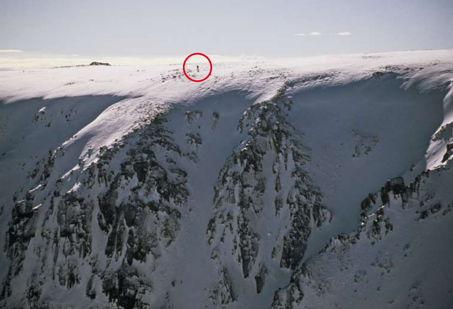
● L'alpinista queda empetitit entre la llum de la carena i l'ombrívol vessant nord del pic de la Dona.

de Morenç. Pugem fins a la part alta del telesquí del Clot de la Xemeneia i d'aquí al coll del mateix nom. Si les pales del vessant NW no estan carregades de neu inestable o ventada, baixarem per una pala mantinguda de 35° al fons de la coma de Bacivers. En cas contrari, s'aconsella carenejar al SW cap al puig d'Ombriaga i el coll de la Geganta, des d'on cal dirigir-se a l'W i després al N fins a la coma de Bacivers. Quan arribem a la part baixa de l'aresta NE del pic de Prat de Bacivers, la contornejarem per atènyer els itineraris que ens interesen (2.30 - 3 h).