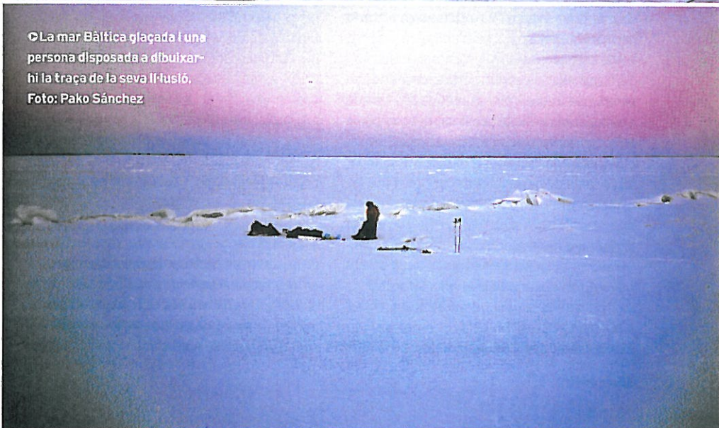
La mar Bàltica glaçada i una persona disposada a dibuixar-hi la traça de la seva il·lusió.